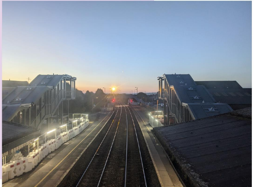
Llanelli Station, April 2024

We have detailed the latest from each of the Access for All stations below, and hope that you find these updates useful.